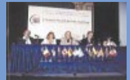
Rencontre internationale des réseaux citoyens à Buenos Aires en décembre 2001.

À Barcelone, outre les échanges d'expériences, ateliers et panels, était créée la Coalition mondiale des réseaux des citoyens GlobalCN qui vise notamment à renforcer la synergie entre les réseaux et à organiser des activités et événements conjoints axés sur une participation des groupes de base et des citoyens. Elle veut impulser de nouveaux modèles de développement local durable d'utilisation des TIC et à obtenir la participation des réseaux citoyens dans la définition des politiques tant au niveau local que national ou international.